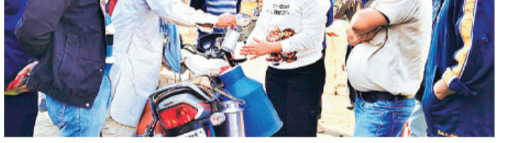
दूध की जांच

दूध के 44 सैंपलों में 1 में यूरिया, 3 सैंपल असामान्य, 18 में मिला पानी