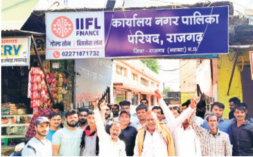
कार्यालय नगर पालिका परिषद, राजगढ़

हालांकि, सभी 14 निकायों से कर्मचारियों को हटाए जाने के आदेश फिलहाल तक जारी नहीं हुए हैं पर उक्त संबंध में संपूर्ण जानकारी जिला शहरी विकास अभिकरण को भेजी गई है। कुछ निकायों ने अपने यहां पदस्थ कर्मचारियों के संबंध में कलेक्टर कोर्ट में भी प्रकरण/दस्तावेज प्रस्तुत कर दिए हैं।