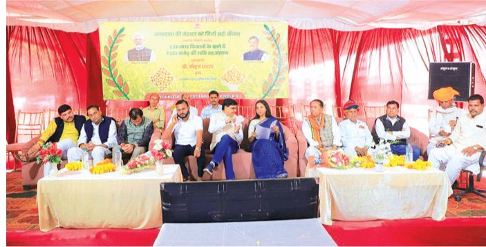
का काम किया जा रहा है।