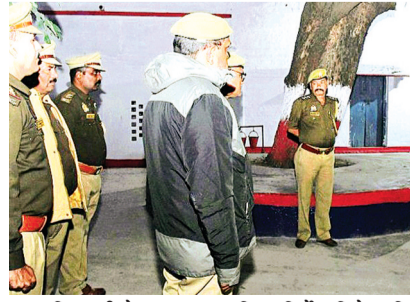
सतत निगरानी हेतु आवश्यक दिशा निर्देश दिये। महिलाओं की सुरक्षा हेतु एन्टीरोमियो स्कॉवड व मिशन शक्ति टीम को निरंतर थाना क्षेत्र स्कूल, कॉलेज, पार्सों आदि जगहों पर भ्रमण करने हेतु आदेशित किया गया जिससे महिला सम्बंधी अपराध न हो

पाए तथा शासन की जीरो टॉलरेंस नीति पर काम करें। प्रभारी निरीक्षक थाना तालबेहट को साइबर अपराध जागरूकता अभियान चलाकर, आमजन को जागरूक करने हेतु निर्देशित किया गया। एसपी ने प्रभारी निरीक्षक थाना तालबेहट को थाना क्षेत्र में प्रमुख भीड़-भाड़ वाले चौराहों, सपाफा बाजार, व्यवसायिक प्रतिष्ठानों आदि जगहों पर पेट्रोलिंग के सम्बन्ध में आवश्यक दिशा-निर्देश दिये। सर्दी के मौसम के दृष्टिगत, लूट, चोरी, छिन्नीती आदि प्रकार की घटनाओं के पूर्व अपराधियों का भौतिक सत्यापन कर उनके विरुद्ध आवश्यक निरोधक कार्यवाही करने हेतु निर्देशित किया। प्रभारी निरीक्षक तालबेहट को निर्देशित किया गया कि यातायात नियमों का विशेष रूप से पालन कराना सुनिश्चित करें एवं चैकिंग के दौरान बिना हेल्मेट/शराब पीकर आदि वाहन चालकों की चैकिंग कर आवश्यक कार्यवाही के संबंध में दिशा-निर्देश दिये।