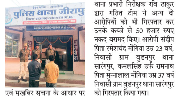
पुलिस थाना जीरापुर

जानकारी के मुताबिक 15 अक्टूबर को भैंस बाजार जीरापुर में फरियादी के साथ 60 हजार रूपए की झपट्टामारी हुई थी। फरियादी द्वारा घटना की रिपोर्ट दर्ज कराई गई, जिस पर अपराध पंजीबद्ध किया गया। पुलिस ने प्रारंभिक जांच में एक आरोपी को मौके पर ही पकड़ लिया था। तत्पश्चात सघन पूछताछ